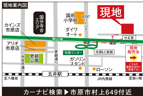
カーナビ検索 ▶ 市原市村上649付近

★アリオ市原近く!! ★市原IC付近!! ★のびのびと子育てが出来る 閑静な住宅地!!